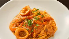
漁師風トマトソーススパゲッティ