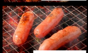
ソーセージ2種盛り