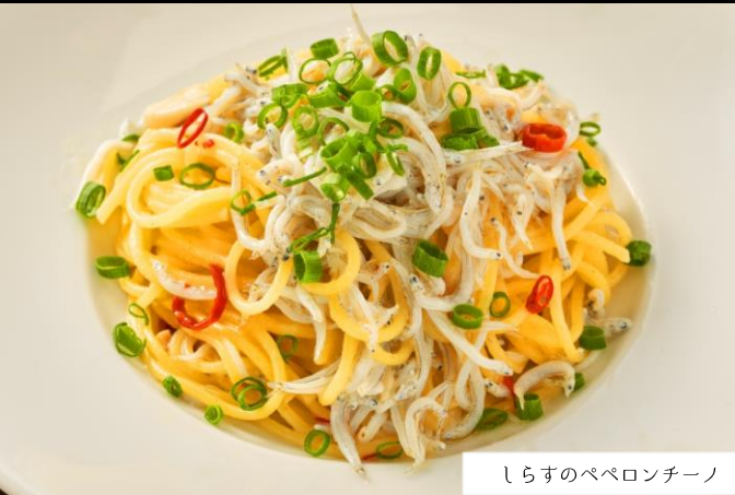
しらすのペペロンチーノ