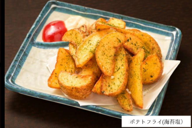
ポテトフライ(海苔塩)