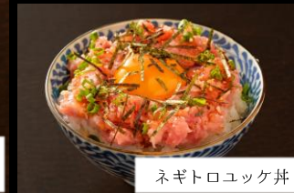
ネギトロユッケ丼