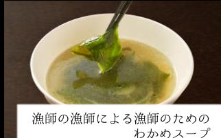
漁師の漁師による漁師のための わかめスープ