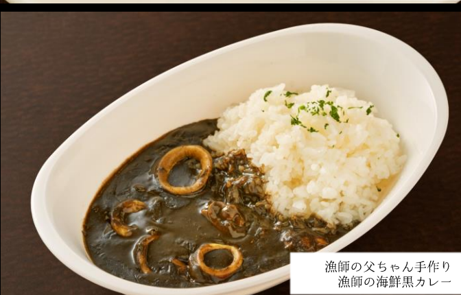
漁師の父ちゃん手作り 漁師の海鮮黒カレー