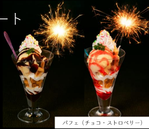
パフェ(チョコ・ストロベリー)