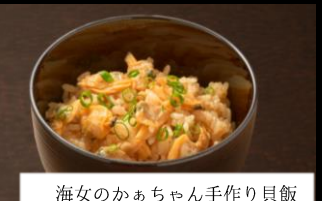
海女のかあちゃん手作り貝飯