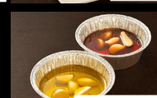
アヒージョセット