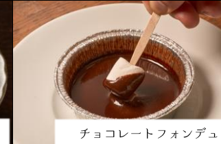
チョコレートフォンデュ