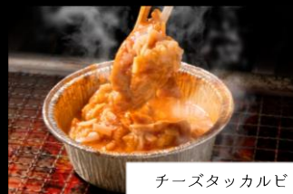
チーズタッカルビ