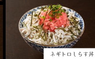
ネギトロしらす丼