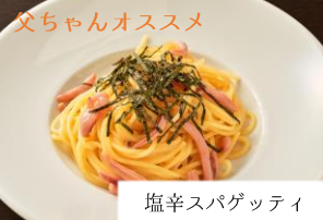
塩辛スパゲッティ