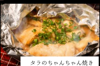
タラのちゃんちゃん焼き